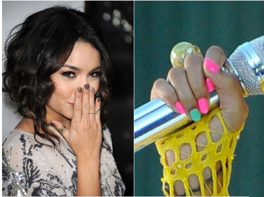
Vanessa Hudgens e Beyoncé lançam tendência.