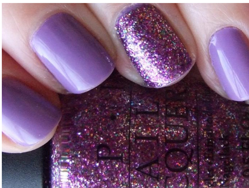
A tendência da 'unha filha única'.