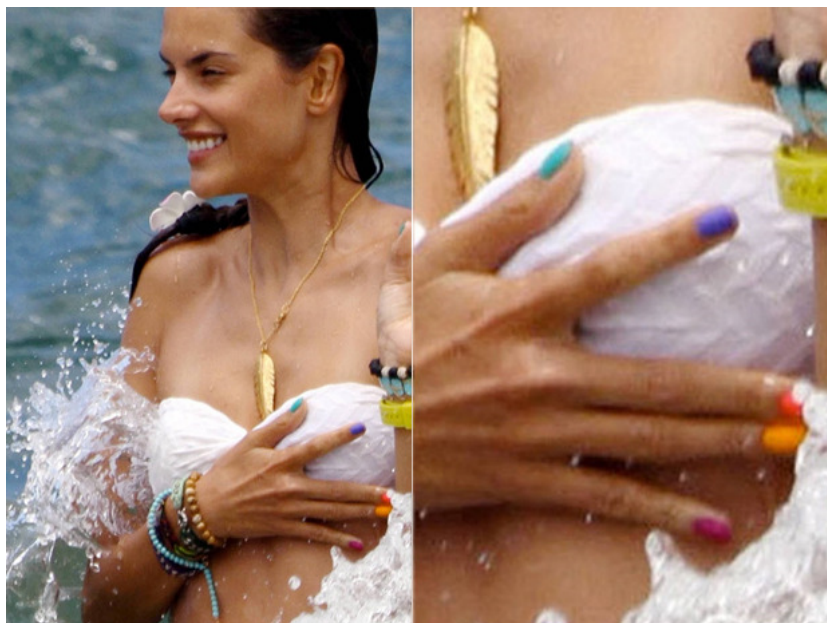
Alessandra Ambrósio é adepta da moda 'uma unha de cada cor'.