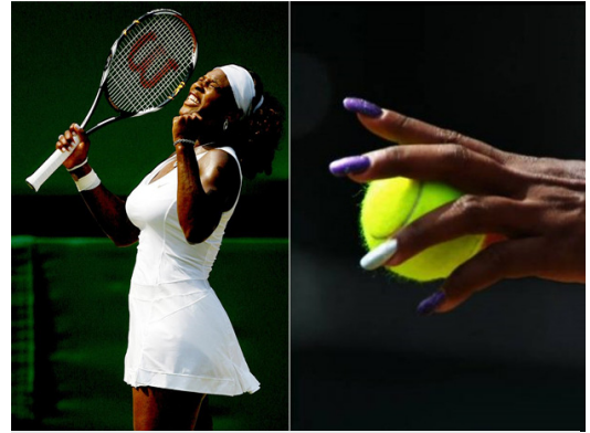
A tenista Serena Williams é fã da 'unha filha única'.